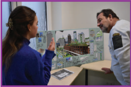
Eindwerkstukken Pag. 2