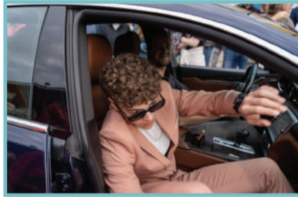
Gala Pag. 3