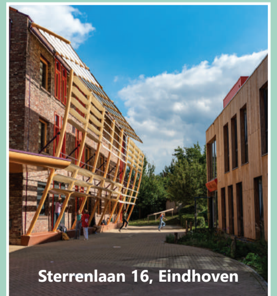
Sterrenlaan 16, Eindhoven