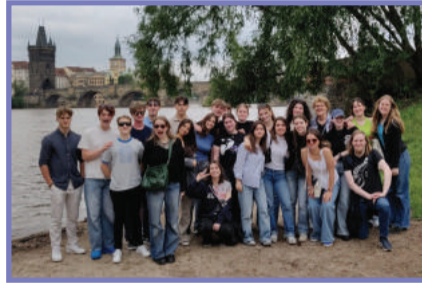
Goodbye Pag. 4