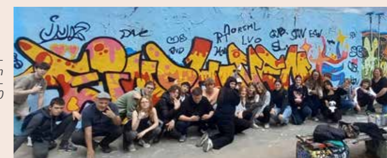
Eindhoven art, ver-euwigd in Berlijn door eindexamen-klas 10