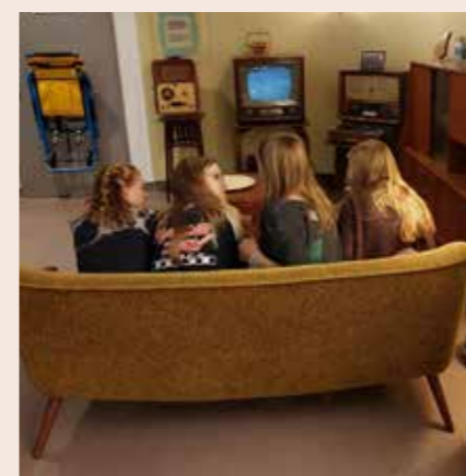
Klas 8 op bezoek in het museum. Over 'old school' gesproken...