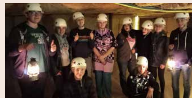
Klas 9 in de grotten tijdens de geologie week.

Ieder jaar doet de school mee met de Waldorf One World (WOW) actiedag waarbij de leerlingen zich inzetten om geld in te zamelen om het vrijeschoolonderwijs in het buitenland te ondersteunen. De leerlingen krijgen in de voorbereiding ook les over de omstandigheden van de mensen in een specifiek gebied. De afgelopen jaren gaf de school hulp aan een nieuwe vrijeschool die is opgericht door boeren in Nepal en een vrijeschool in oprichting in Kakuma, het grootste vluchtelingenkamp ter wereld in Kenia. Ook stonden WOW-dagen in het teken van Nina Pacha, een schoolgemeenschap in Ecuador en opvangcentrum Mundo Feliz, in één van de armste en kwetsbaarste wijken van Santiago. Niet alleen brengen de leerlingen mooie bedragen bij elkaar, ook genieten ze van de activiteiten.