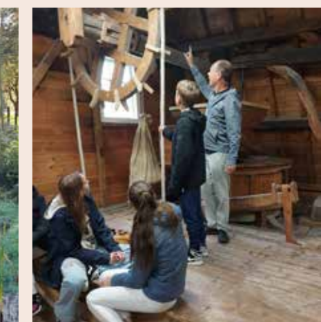
Klas 7 in de molen