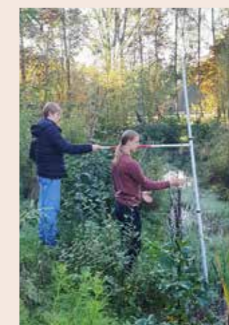
Landmeten in klas 10