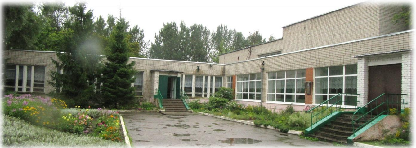
School#20 Lyceum for Natural Science and Mathematics in Pskov